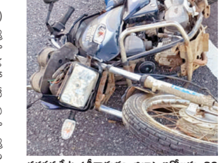
నరసన్నపేట (శ్రీకాకుళం జిల్లా) అక్టోబరు 20 ప్రభాతవార్త: నరసన్నపేట మండల కేంద్రానికి