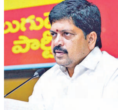
ఆయన పాలనలో ఇసుక, మద్యం ద్వారా

విజయవాడ అక్టోబరు 20 ప్రభాతవార్త ప్రతినిధి: కవిత ఇసుక విధానాన్ని పక్కాగా అమలు చేసేందుకు సామాన్యులకు మరింత సౌకర్యంగా ఉండేందుకు సీనరేజ్ ద్వారా వచ్చే రూ.264 కోట్ల ఆదాయాన్ని కూడా వద్దనుకున్నట్లు ఎక్సైజ్ గనులశాఖ మంత్రి కొల్లు రవీంద్ర స్పష్టం చేశారు. కేవలం ఆపరేషన్ చార్జీలు మాత్రమే తీసుకోవడాకు సన్నద్ధుడై వెళ్లినట్లు తెలిపారు. గతంలో ఎక్కడైతే మాత్రమే ఉచితంగా ఇసుక తీసుకోవడానికి వచ్చినా, ఇప్పుడు ప్రాకారం కూడా ఆ అవకాశం ఇచ్చినట్లు తెలిపారు. కావాలంటే మాజీ ముఖ్యమంత్రి జగన్ స్వయంగా వచ్చి ప్రాకారాల్లో ఇసుకను తాడేపల్లి ప్యారెస్ కు తీసుకువెళ్ళవచ్చన్నారు.