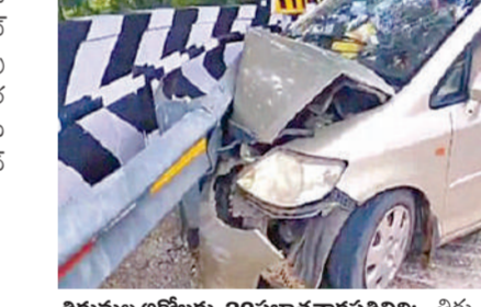
తిరుమల, అక్టోబరు 20 ప్రభాతవార్త ప్రతినిధి: తిరుమల నుండి తిరుపతికి దిగుతున్న వాహనం

అదుపుతప్పి మొదటిఫోటోలో 15వ ములుపువద్ద డివైడర్ ను ఢీ కొంది. అది వారం ఉదయం జరిగిన ఈ సంఘటనలో తమిళనాడు తిరువనకల్పూరుకు చెందిన నలుగురు భక్తులకు గాయాలు అలకు గురయ్యారు. వాహనాన్ని మలుపు వద్ద తిప్పుతుండగా అదుపుతప్పి రైలు లైన్ గుండు ఢీ కొనడంతో ప్రమాదం జరిగింది. ట్రాఫిక్ స్తంభించింది. సమాచారం అందుకున్న విజిలెన్స్ అధికారులు అక్కడ చేరుకుని వాహనాన్ని తోలగింపడంతో వాహనాలు కడిచాయి.